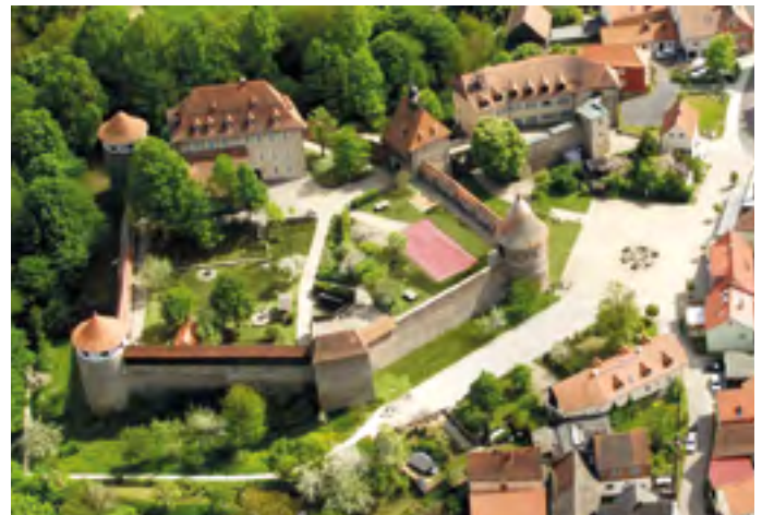
Fast genau 60 Jahre lang war die Burg Hohenberg an der Eger an der bayerisch-böhmischen Grenze eine Heimstätte des Sudetendeutschen Sozial- und Bildungswerks.

In unserer Erklärung gegenüber der Öffentlichkeit über die absehbare Beendigung des Mietverhältnisses zwischen dem Freistaat Bayern und der Stiftung SSBW haben wir die hohe politische und emotionale Bedeutung des ziemlich genau 60-jährigen Wirkens des Sudetendeutschen Sozial- und Bildungswerks in