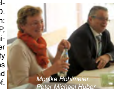
Monika Hohlmeier, Peter Michael Huber