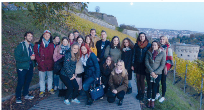
Landeskundliche Exkursion einer Studentengruppe nach Würzburg

In diesem Jahr beging die Akademie Mitteleuropa ein halbrundes Jubiläum: Vor 15 Jahren wurde sie auf dem Heiligenhof gegründet. Mit zehn hochqualitativen Maßnahmen in 2017 leisteten die Seminare der AME einen entscheidenden Anteil zu der hervorragenden Bildungsarbeit auf dem Heiligenhof. Die Akademie verfolgt seit ihrer Gründung 2002 die Zielsetzung, die autochthone deutsche Kultur und Geschichte im östlichen Europa – in den ehemaligen deutschen Reichs- und Siedlungsgebieten – sowie die Beziehungsgeschichte und Gegenwart zwischen Deutschland und seinen östlichen Nachbarn zu pflegen, zu erforschen und weiterzuentwickeln. Insbesondere sieht sie ihren Schwerpunkt in der Förderung und Vernetzung des akademischen Nachwuchses aus Deutschland und den östlichen Nachbarländern. Die Seminare der Akademie wurden in diesem Jahr von 400 Teilnehmerinnen und Teilnehmern aus Deutschland, Tschechien, Polen, Rumänien, der Ukraine und Ungarn besucht. Herausragend in diesem Jahr war die 12. Mitteleuropäische Nachwuchsgermanistentagung mit dem Schwerpunktthema „Kindheit und Jugend in autobiographischen und fiktionalen Texten deutschsprachiger Autoren aus dem östlichen Europa“ sowie eine Tagung zur Kulturgeschichte der Bukowina, eine Studententagung zu „Europäischen Erinnerungskulturen“ sowie die 6. „Mitteleuropäische Archivtagung“. Zum 10. Mal wurde die Internetreferententagung aus dem Spektrum ostdeutscher Verbands- und Kulturarbeit mit rund 40 Teilnehmenden durchgeführt.