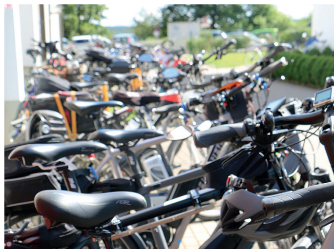
Auch die Fahrräder haben mal Pause am Heiligenhof