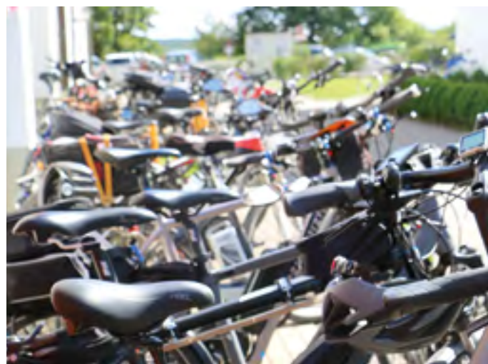
Auch die Fahrräder haben mal Pause am Heiligenhof