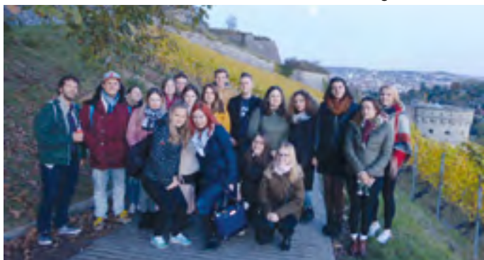
Landeskundliche Exkursion einer Studentengruppe nach Würzburg

In diesem Jahr beging die Akademie Mitteleuropa ein halbrundes Jubiläum: Vor 15 Jahren wurde sie auf dem Heiligenhof gegründet. Mit zehn hochqualitativen Maßnahmen in 2017 leisteten die Seminare der AME einen entscheidenden Anteil zu der hervorragenden Bildungsarbeit auf dem Heiligenhof. Die Akademie verfolgt seit ihrer Gründung 2002 die Zielsetzung, die autochthone deutsche Kultur und Geschichte im östlichen Europa – in den ehemaligen deutschen Reichs- und Siedlungsgebieten – sowie die Beziehungsgeschichte und Gegenwart zwischen Deutschland und seinen östlichen Nachbarn zu pflegen, zu erforschen und weiterzuentwickeln. Insbesondere sieht sie ihren Schwerpunkt in der Förderung und Vernetzung des akademischen Nachwuchses aus Deutschland und den östlichen Nachbarländern. Die Seminare der Akademie wurden in diesem Jahr von 400 Teilnehmerinnen und Teilnehmern aus Deutschland, Tschechien, Polen, Rumänien, der Ukraine und Ungarn besucht. Herausragend in diesem Jahr war die 12. Mitteleuropäische Nachwuchsgermanistentagung mit dem Schwerpunktthema „Kindheit und Jugend in autobiographischen und fiktionalen Texten deutschsprachiger Autoren aus dem östlichen Europa“ sowie eine Tagung zur Kulturgeschichte der Bukowina, eine Studententagung zu „Europäischen Erinnerungskulturen“ sowie die 6. „Mitteleuropäische Archivtagung“. Zum 10. Mal wurde die Internetreferententagung aus dem Spektrum ostdeutscher Verbands- und Kulturarbeit mit rund 40 Teilnehmenden durchgeführt.